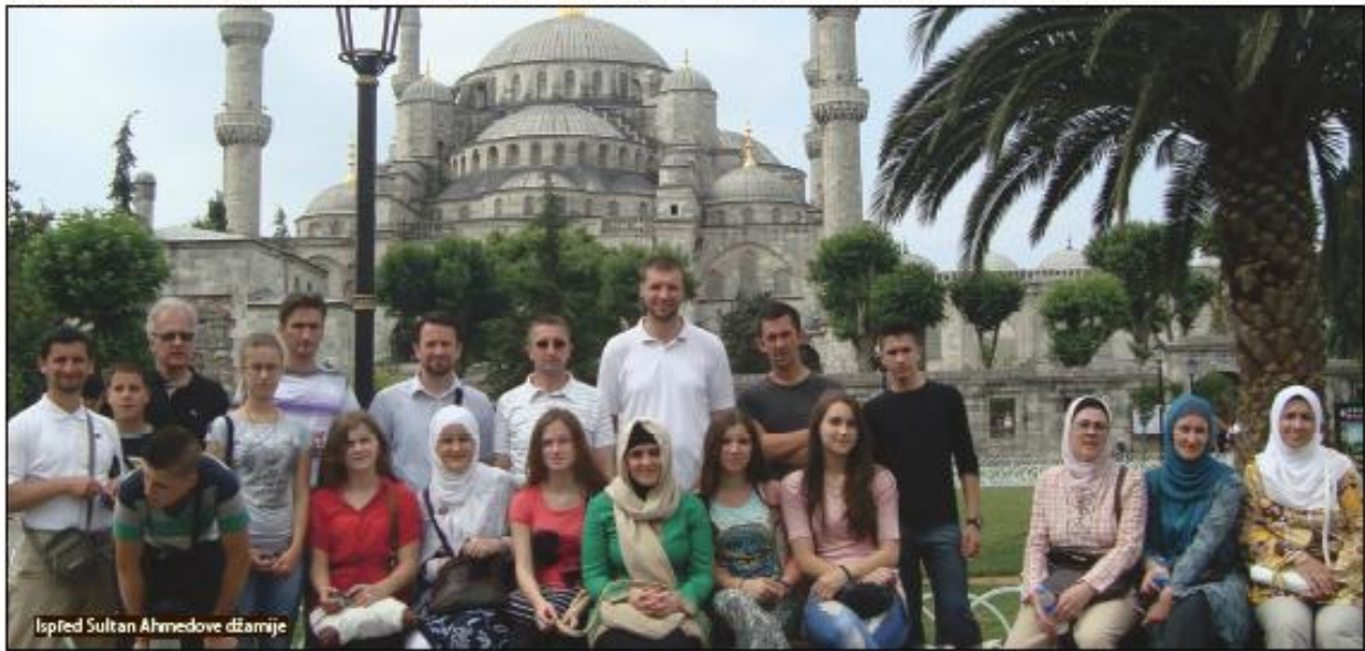
Ispjed Sultan Ahmedove džamije

Sa puta smo se vratili puni utisaka i jer je, sasvim sigurno, dugo ostati u sjećanju svakog od učesnika.