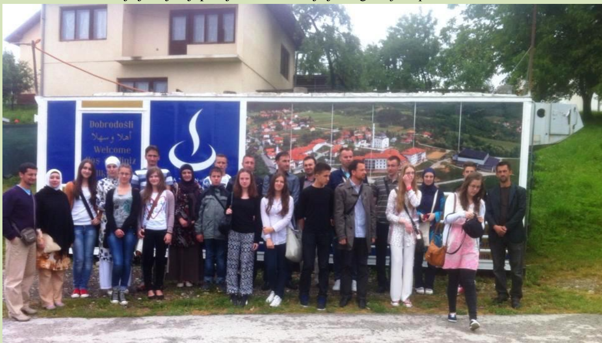
U Medresi su dočekani od ljubaznog osoblja.

Na putu po BiH, učesnici takmičenja su prvo obišli Medresu Osman ef. Redžović u Velikom Čajnu – Visoko, koja je najbolji primjer kako se vizija jednog čovjeka pretvara u realnost.