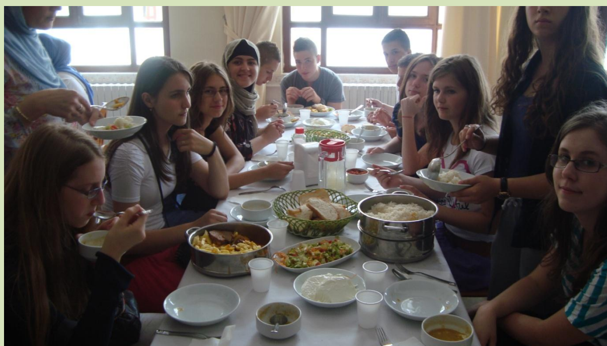
Omladina (naši Takmičari) u druženju na zajedničkom ručku u koledžu na Čamlidži.