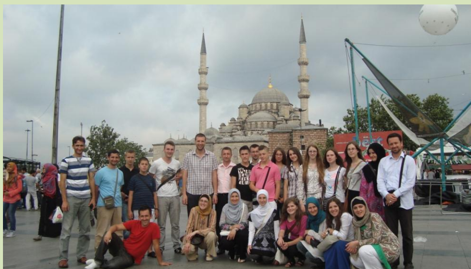
Zajednička fotografija ispred Jeni-džamije.