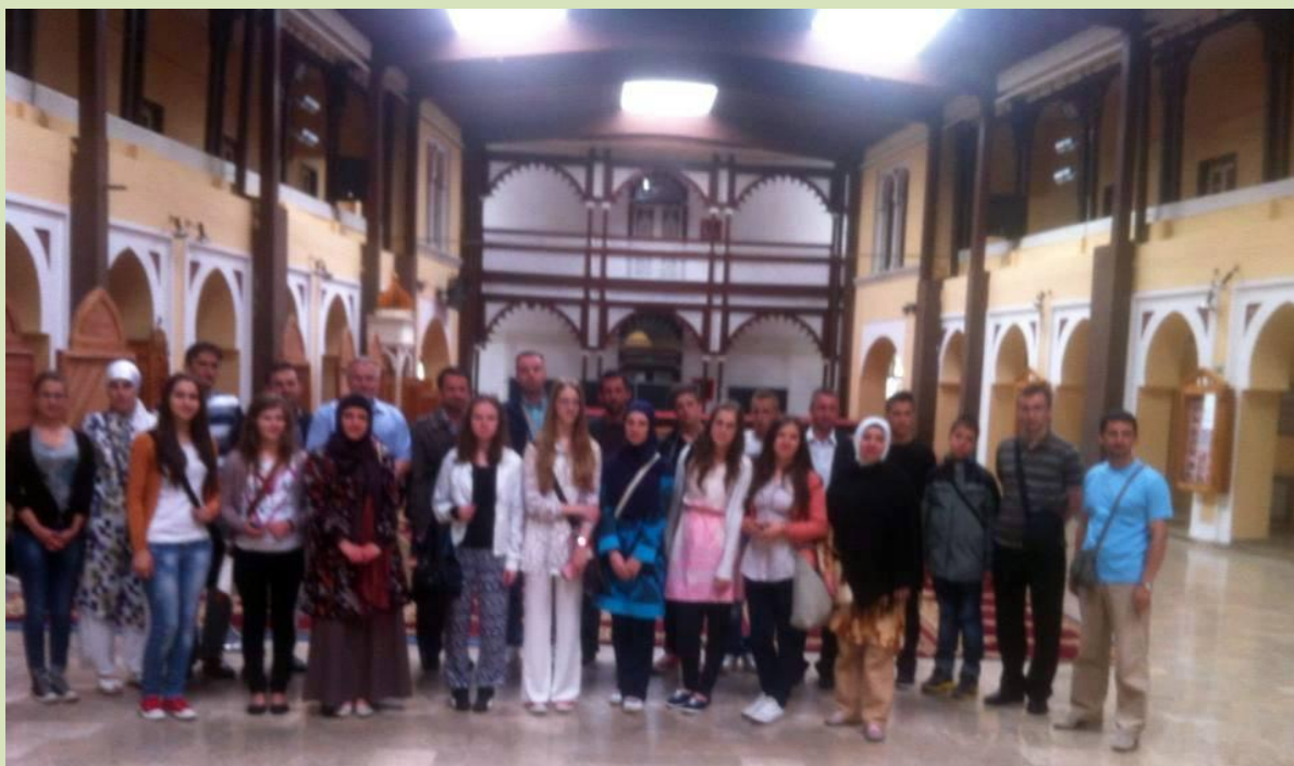
Učesnici takmičenja u prostorijama Elči Ibrahim-pašine medrese.

Nakon toga su posjetili Elči Ibrahim-pašinu medresu u Travniku gdje su ih također dočekali ljubazni domaćini.