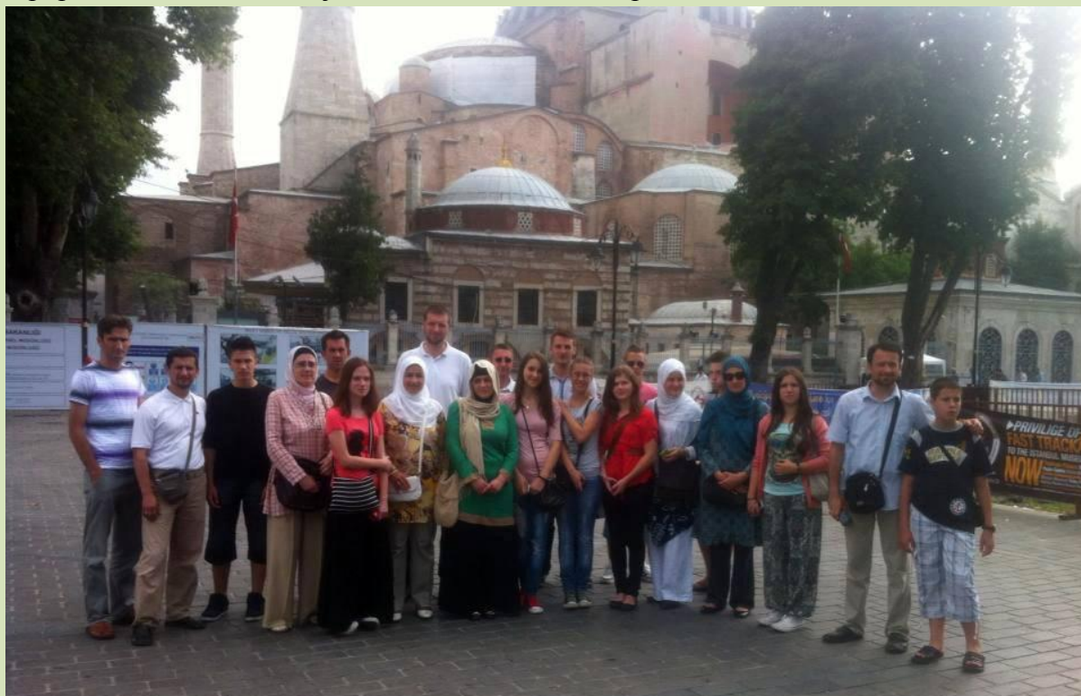
Pred prelijepom Aja-sofijom.

Jedno od najvećih i najznačajnijih obilježja Istanbula je, svakako, posjeta Sultan Ahmedovoj ili Plavoj džamiji. Prije nje, učesnici Takmičenja su obišli Aja-sofiju, ulaz u Topkapi palaču, Hamam sultanije hurem i nezaobilazni Hipodrom.