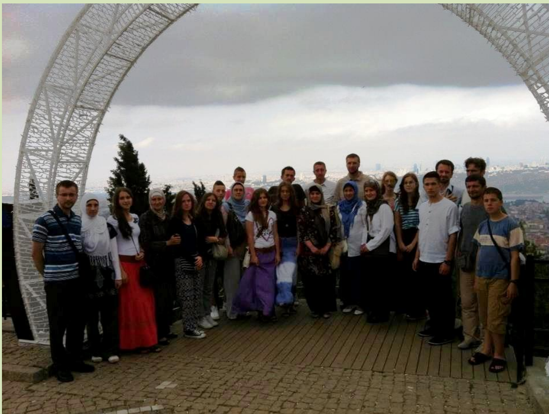
Čamlidža je prelijepo odmaralište iznad Istanbula sa kojeg se pruža prelijepi pogled i na evropski i na azijski dio Istanbula.