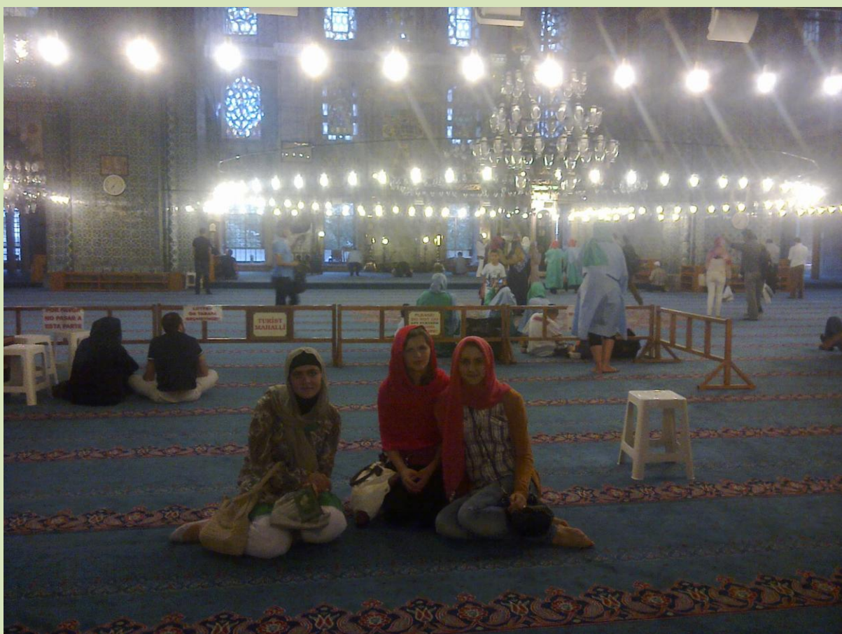
Unutrašnjost Plave džamije.

Poslije obilaska Plave džamije, svi učesnici su se uputili ka čuvenoj Kapali čaršiji.