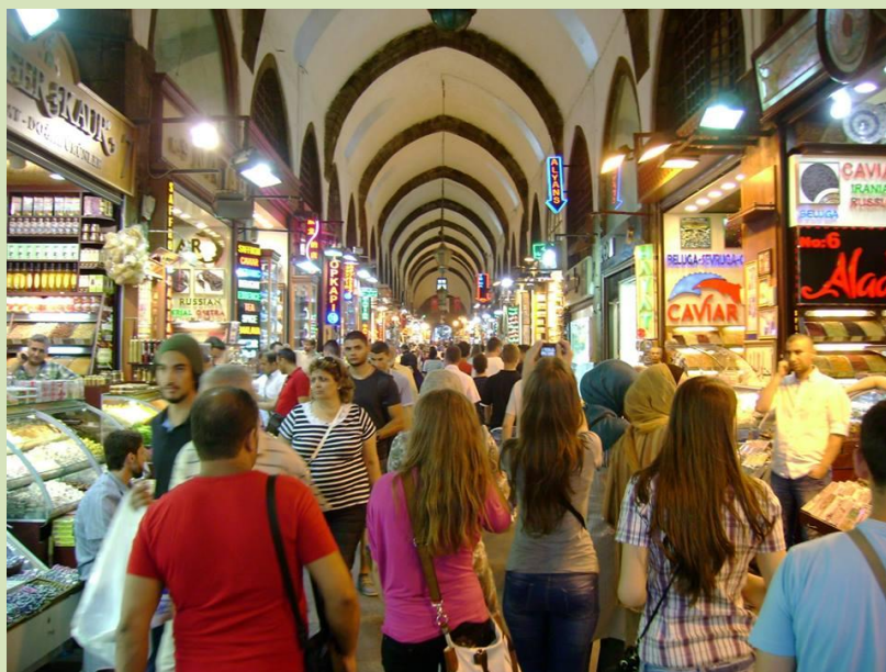
Detalj sa posjete Misir-pijaci.