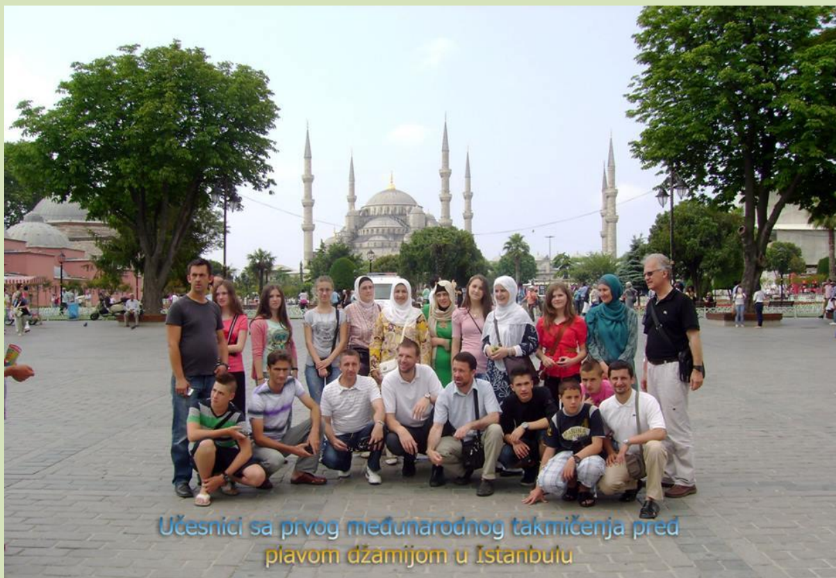
Učesnici sa prvog međunarodnog takmičenja pred plavom džamijom u Istanbulu