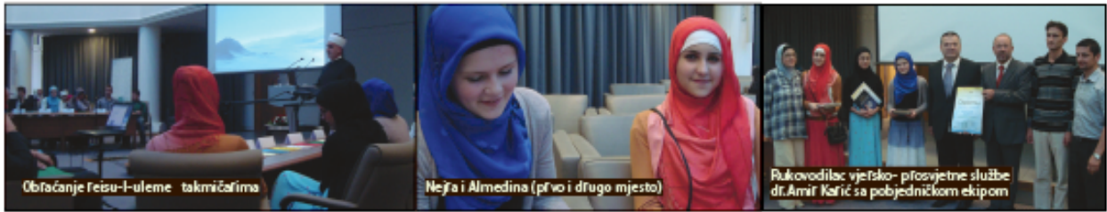
Obraćanje reisu-l-uleme takmičarima