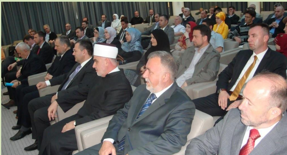
Prisutni su sa velikom pažnjom pratili sam tok Takmičenja.