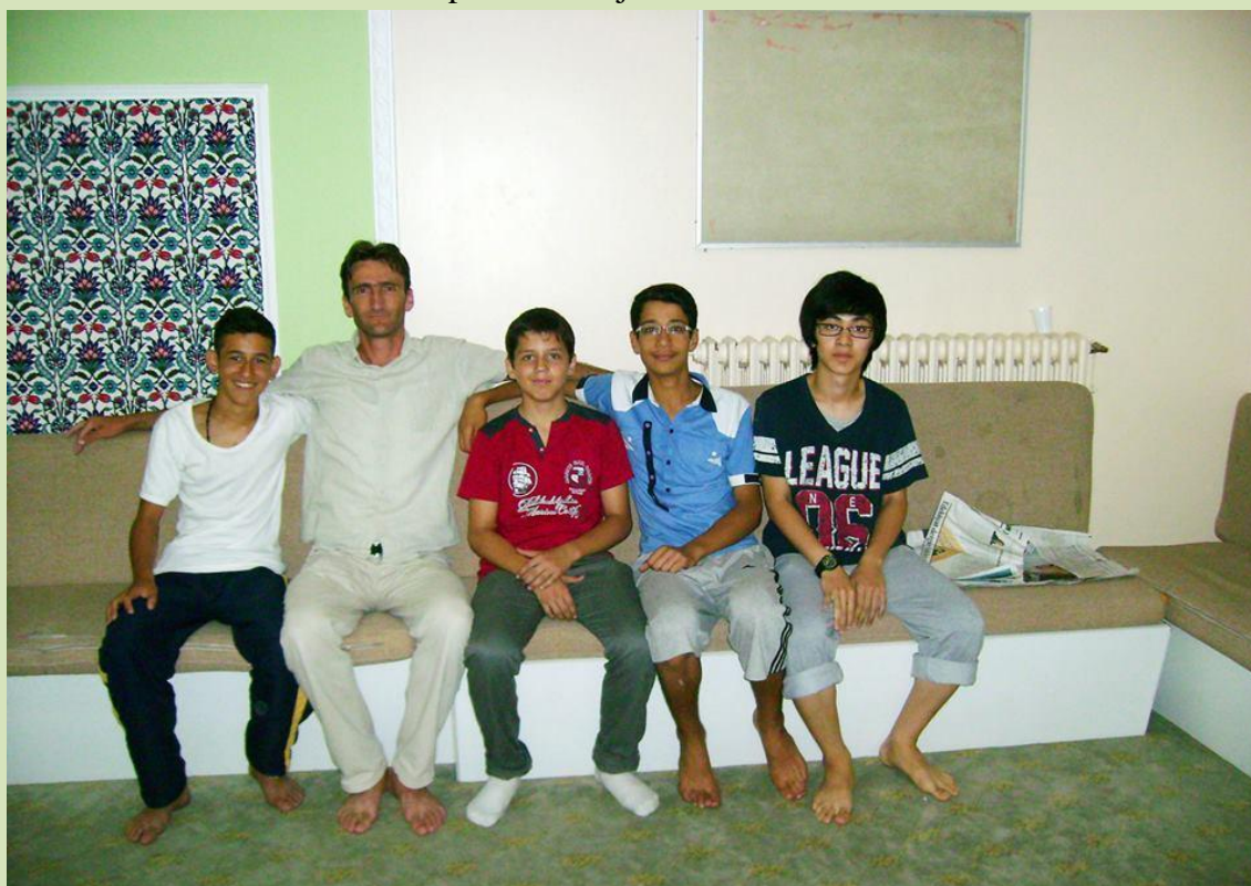
Detalj sa posjete Koledžu na Čamlidži u kome se pripremaju zainteresirani stranci za upis na turske fakultete.