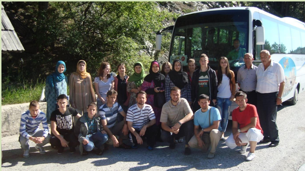
Višegrad – oproštaj od ekipe iz Sandžaka (R. Srbije)