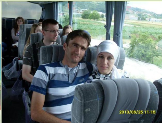
Na put se krenulo sa ugodnim novim autobusima agencije Fidan Tours.