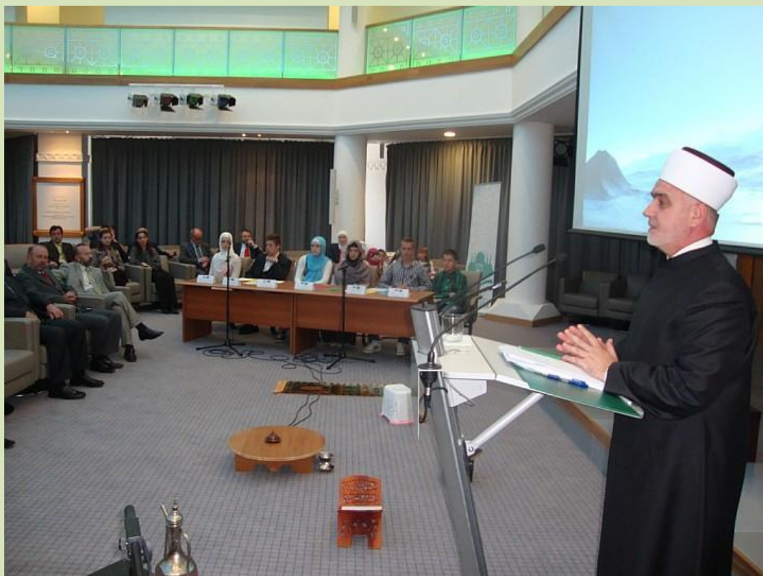
Obraćanje Resiu-l-uleme učesnicima Takmičenja i svim prisutnim.

Sarajevo, 26. juni 2013. (MINA) – U novoj zgradi Gazi Husrev-begove biblioteke u Sarajevu danas je počelo prvo međunarodno takmičenje iz islamske vjeronauke. Učestvuju ekipe iz Austrije, Hrvatske, Bosne i Hercegovine i Srbije.