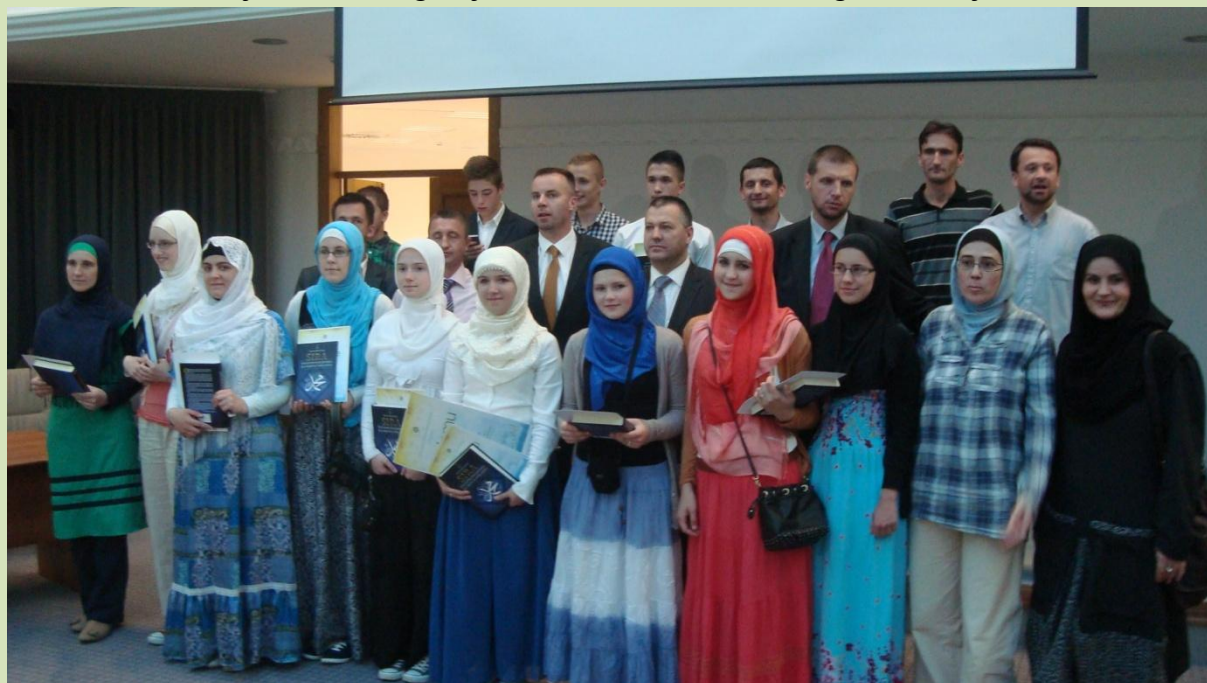
Zajednička fotografija učesnika 1. međunarodnog takmičenja.