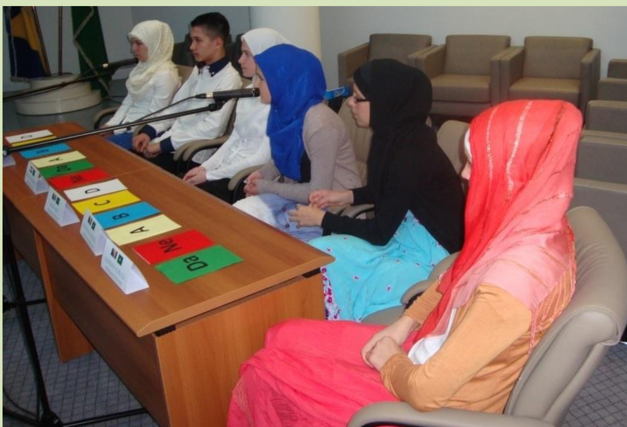
Iščekivanje početka takmičenja i spremnost ekipa da iskažu svoja znanja i sposobnosti.